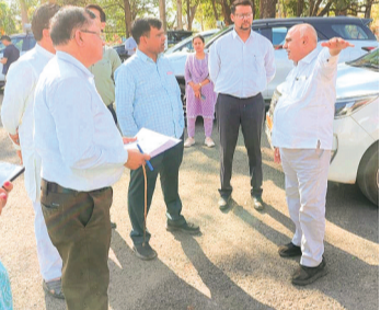
हरिभूमि न्यूज़ ॥ बैतूल

बैतूल में 3 करोड़ की राशि से बनेगा आधुनिक सर्किट हाउस