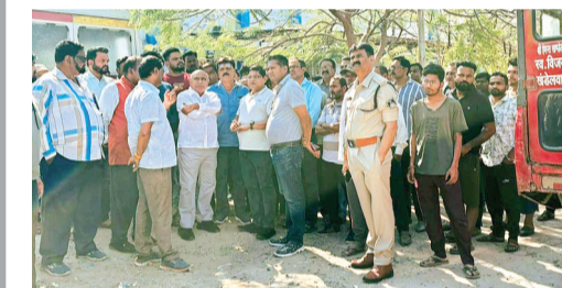
जानकारी ली तथा उपस्थित चिकित्सकों और अधिकारियों को बेहतर से बेहतर उपचार उपलब्ध कराने के निर्देश दिए। उन्होंने घायलों के शीघ्र स्वास्थ्य लाभ की कामना की।