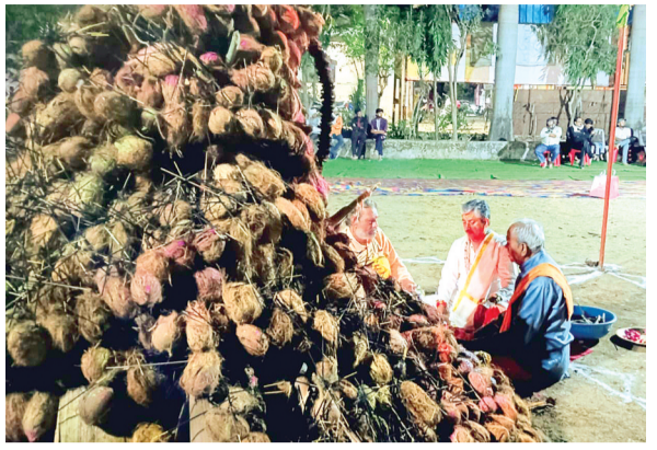
हरिभूमि न्यूज़ | सोहागपुर

नारियलों की होली जलाकर दिया पर्यावरण संरक्षण का संदेश