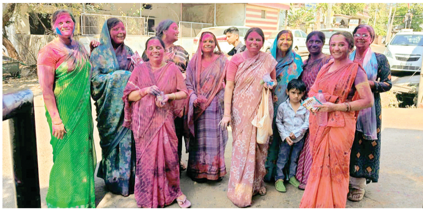
हरिभूमि न्यूज ▶▶ हरदा

शहर में मंगलवार को होली का पर्व हॉल्लेस के साथ मनाया गया, हालांकि चंद्र ग्रहण का सूतक होने के कारण अधिकांश लोग बुधवार को होली मनाएंगे। सोमवार रात होलिका दहन के बाद मंगलवार को सुबह से ही शहर में कुछ लोगों में उत्साह का माहौल देखने को मिला। धुलेंडी पर लोगों ने रंग और गुलाल से एक-दूसरे को बधाई दी। इस बार चंद्रग्रहण के कारण कुछ स्थानों पर रंग खेलने में थोड़ी सावधानी भी देखी गई। शहर के अधिकांश बाजार सामान्य दिनों की तरह खुले रहे, जबकि कई मोहल्लों में रंगोत्सव की